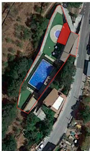
ORTOFOTOGRAFIA DE MÁXIMA ACTUALIDAD COLOR - PNOA

El recinto de la Piscina municipal está compuesto por los siguientes usos actuales en el recinto de equipamientos municipales con las superficies ocupadas por cada uso, y la situación y ocupación del edificio objeto de esta concesión con uso de CANTINA, como bar- cafetería.: